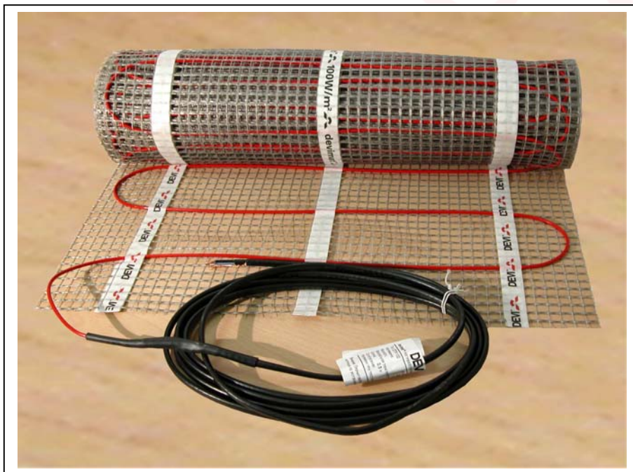
Рис. 1. Нагревательный мат devimat™ DTIF.

Нагревательные маты devimat™ DTIF (рис. 1) применяются для внутренней установки. Используются в ремонтируемых и тонких полах непосредственно под покрытие пола без формирования толстой цементной стяжки и устанавливаются в основном под плитку с плиточным клеем.